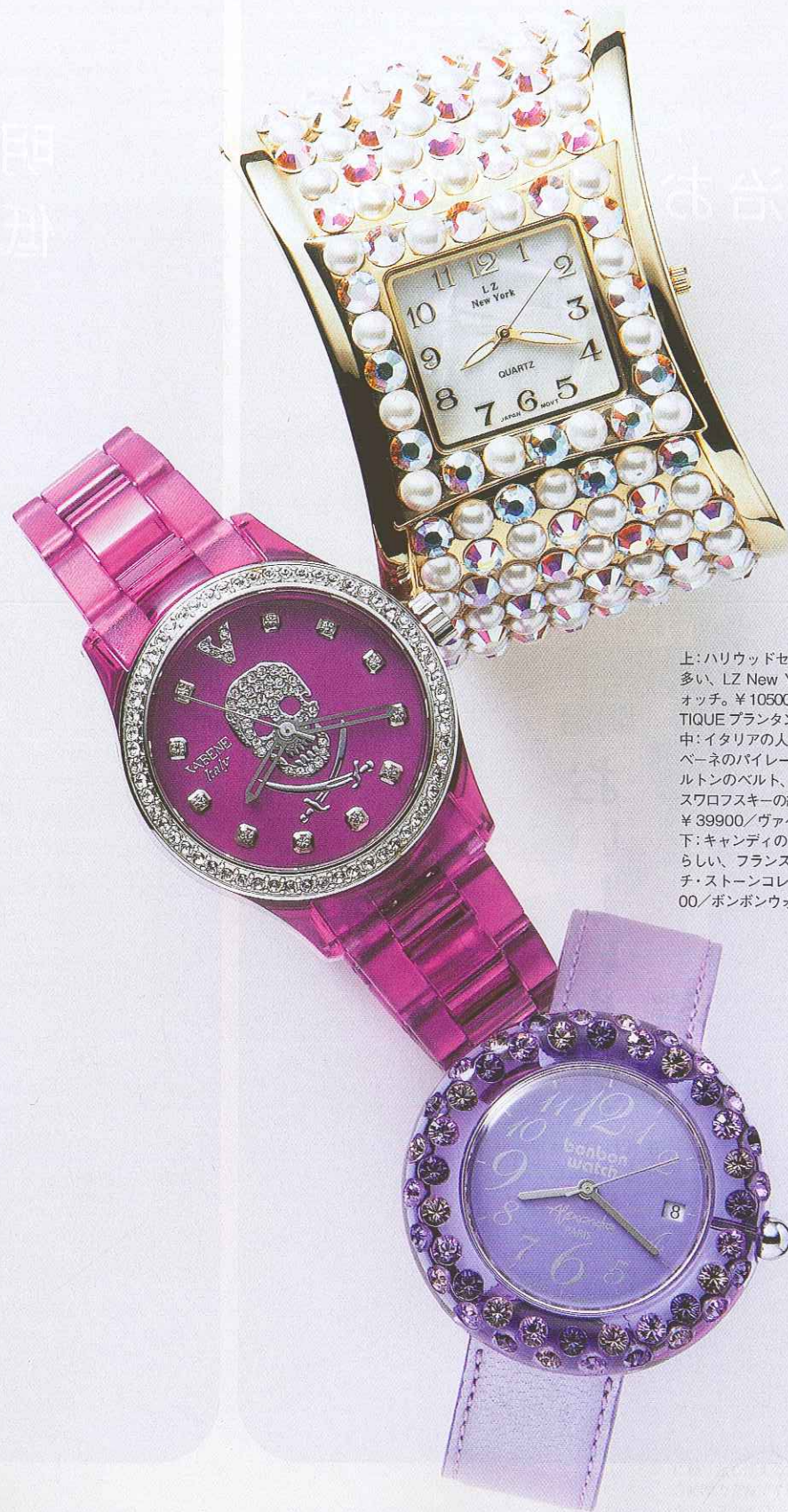
上:ハリウッドセレブにも愛用者が 多い、LZ New Yorkのバングルウ ォッチ。¥10500/JAGURA BOU TIQUE プランタン銀座店 中:イタリアの人気ブランド、ヴァ ペーネのバイレーツシリーズ。スケ ルトンのベルト、スカルモチーフ、 スワロフスキーの組み合わせが絶妙。 ¥39900/ヴァペーネ ジャパン 下:キャンディのような丸い形が愛 らしい、フランスのボンボンウッ チ・ストーンコレクション。¥252 00/ボンボンウッチ原宿店

ネイルも携帯電話もボールペンも 。とにかくキラキラしたものが大好 きなsaita世代。最近、特に街中 で目を惹くのが、動くたびにキラリと 光る手首です。スポーツウオッチのよ うなカジュアルな時計にスワロフスキ ーをちりばめたヴァペーネのバイレー ツシリーズ、カラフルなストーンで縁 取ったボンボンウッチなどがそれ。 日本の芸能人や海外セレブが愛用して いることでも話題で、価格も一桁…二 桁くらい違ってお手頃! 新色が増え てよりカラフルになり、コレクション